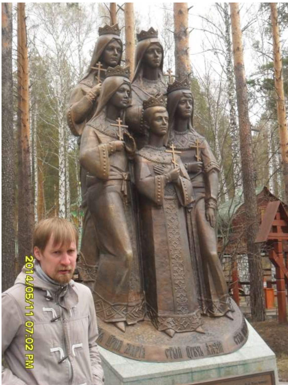
Бюсты царских детей (цесаревич Алексей, Княгини Ольга, Татьяна, Мария и Анастасия, сокращенно - ОТМА)